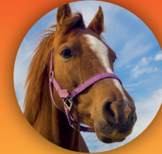
Paarden en ezels