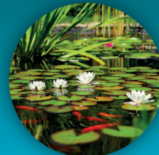
Vijver of pool