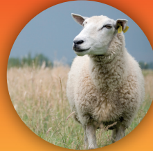
Schapeu en geiten