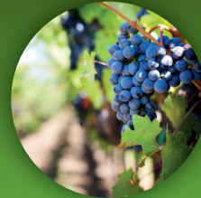
Klimplanten en pergola