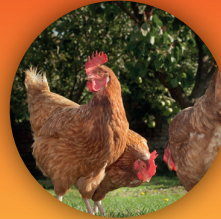
Kippen en eenden